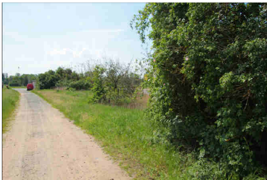
Abb. 6: Feldweg mit beidseitigen Brachflächen an der Ostseite des Plangebietes (Blickrichtung von Norden).

Die einzige im Artenschutzbeitrag zu berücksichtigende Art ist hier der Haussperling, da dieser sich in Hessen in einem ungünstigen Erhaltungszustand befindet und von dem Vorhaben betroffen sein könnte. Für alle anderen Vogelarten, die im Untersuchungsgebiet festgestellt wurden, wird keine erhebliche Betroffenheit gesehen.