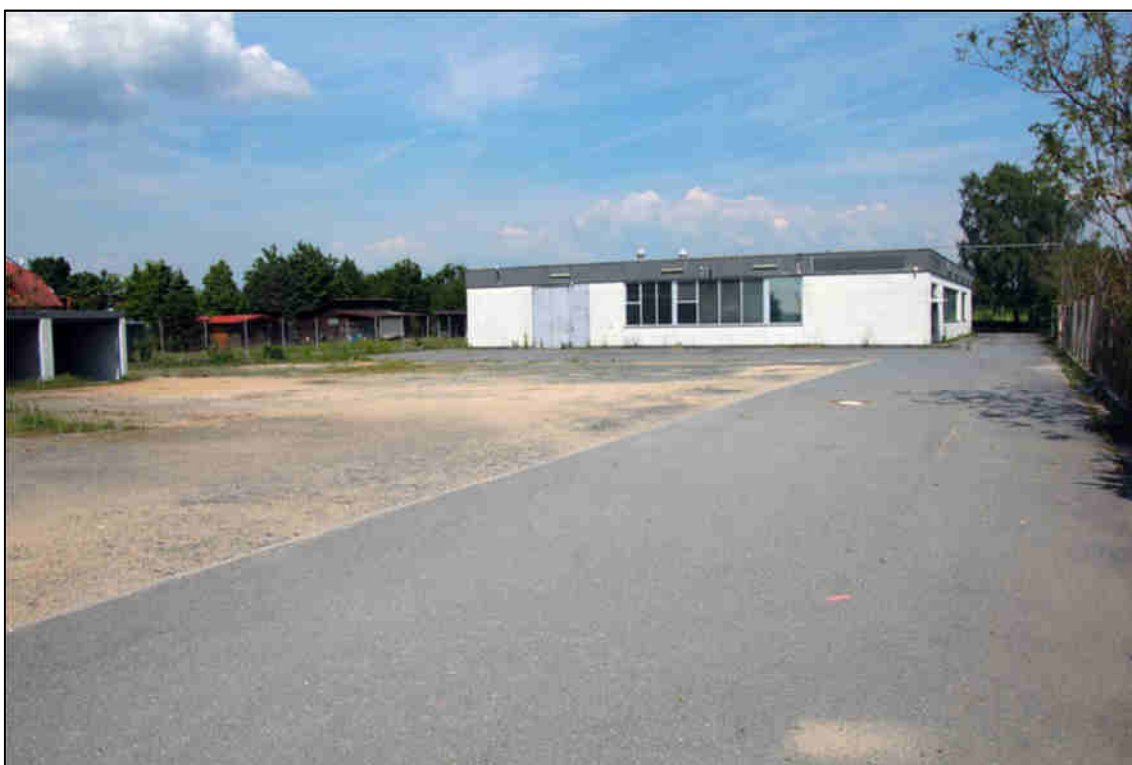
Abb. 1: Blick vom Eingang an der B 486/ Langener Straße.