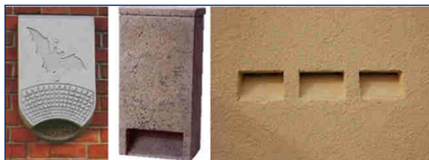
Abb. 9: Beispiele von Fledermauskästen zur Anbringung oder zum Einbau an Gebäuden.