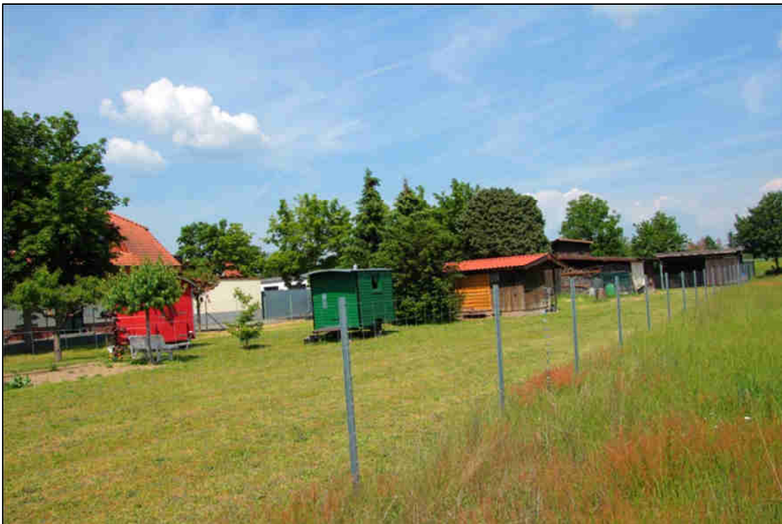
Abb. 4: Nördlicher Teil des Garten- und Freizeitgrundstücks mit Tierhaltung.

Im Rahmen der drei Begehungen wurden zwei Fledermausarten registriert. Wie in fast allen Untersuchungen ist die Zwergfledermaus ( Pipistrellus pipistrellus ) die dominierende Art. Sie ist auch im Siedlungsbereich und in Innenstädten eine verbreitete und häufige Art mit Quartieren an Fassaden und im Dachbereich in Dörfern und Städten. Sie findet in den Grünanlagen und Gehölzen in und um die bebauten Bereiche Gebiete, in denen Sie ihre Nahrung (Fluginsekten) fängt. Es wurden immer nur einzelne Zwergfledermäuse bei den Begehungen registriert. An zwei Abenden wurde zudem jeweils mindestens ein überfliegender Großer Abendsegler mit dem Detektor festgestellt. Quartiermöglichkeiten beschränkten sich weitgehend auf die Gebäude des westlich angrenzend beginnenden Siedlungsbereichs. Hinweise oder Beobachtungen zu Quartieren innerhalb des Untersuchungsgebietes gab es aber nicht. Dies betrifft auch das Gebäude des ehemaligen Abschleppunternehmens, das extra hinsichtlich des Vorkommens von Fledermäusen untersucht wurde.