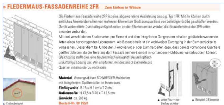
Abb. 8: Einbauelemente als Ersatzquartiere.

Es sind die Empfehlungen von SCHMID et al. (2012) zur Verwendung von Glas an den Gebäuden zu beachten, um den Anflug und damit den Tod von europäisch geschützten Vogelarten zu vermeiden.