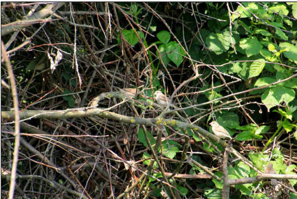
Abb. 7: Haussperlinge im benachbarten Brombeergebüsch.

Weichtiere: Die national besonders geschützte Weinbergschnecke ( Helix pomatia ) und die ebenfalls besonders geschützte Gefleckte Weinbergschnecke ( Helix aspersa ) können im Untersuchungsgebiet vorkommen. Auf Grund des Fehlens von geeigneten Gewässern oder von Feuchtgebieten im Untersuchungsgebiet, ist ein Vorkommen weiterer besonders und streng geschützter Arten (überwiegend Muscheln) nicht denkbar.