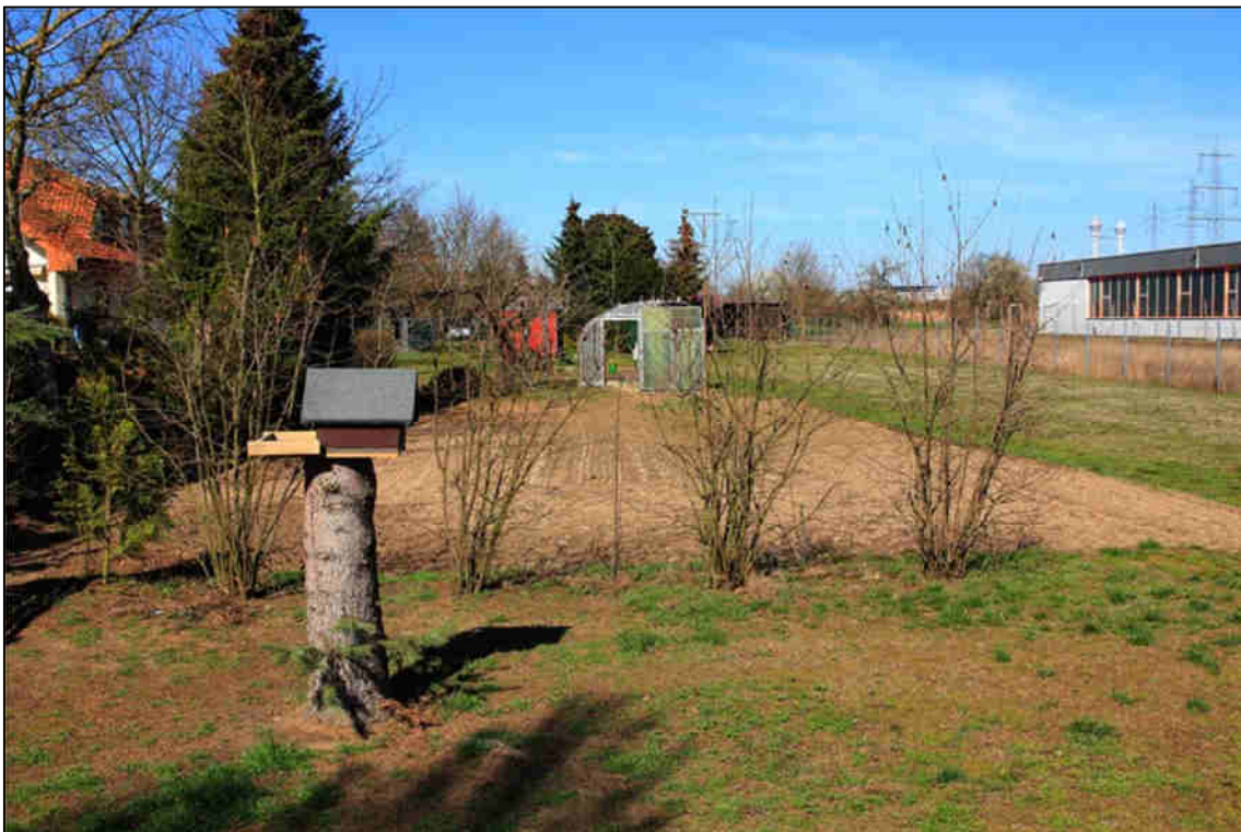
Abb. 5: Südlicher Teil des als Freizeit- und Gartengrundstück und zur Tierhaltung genutzten Teils des Plangebiets, westlich des geplanten Aldi-Marktes.

Vorkommen im Untersuchungsgebiet: Die Zwergfledermaus wurde bei allen drei nächtlichen Begehungen in geringer Zahl mit dem Detektor registriert. Die Quartiere dürften sich überwiegend in Gebäuden des Siedlungsbereichs von Mörfelden befinden.