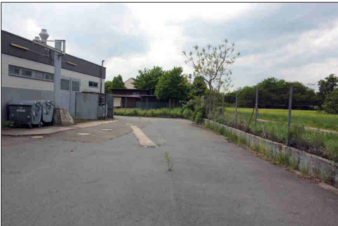
Abb. 3: Rückseite des ehemaligen Abschleppdienstes.

Bei den Begehungen wurde außerdem gezielt nach der streng geschützten Zauneidechse ( Lacerta agilis ) gesucht. Dazu wurden mutmaßlich geeignete Strukturen bei günstiger Witterung langsam abgegangen und nach sich sonnenden Eidechsen gesucht.