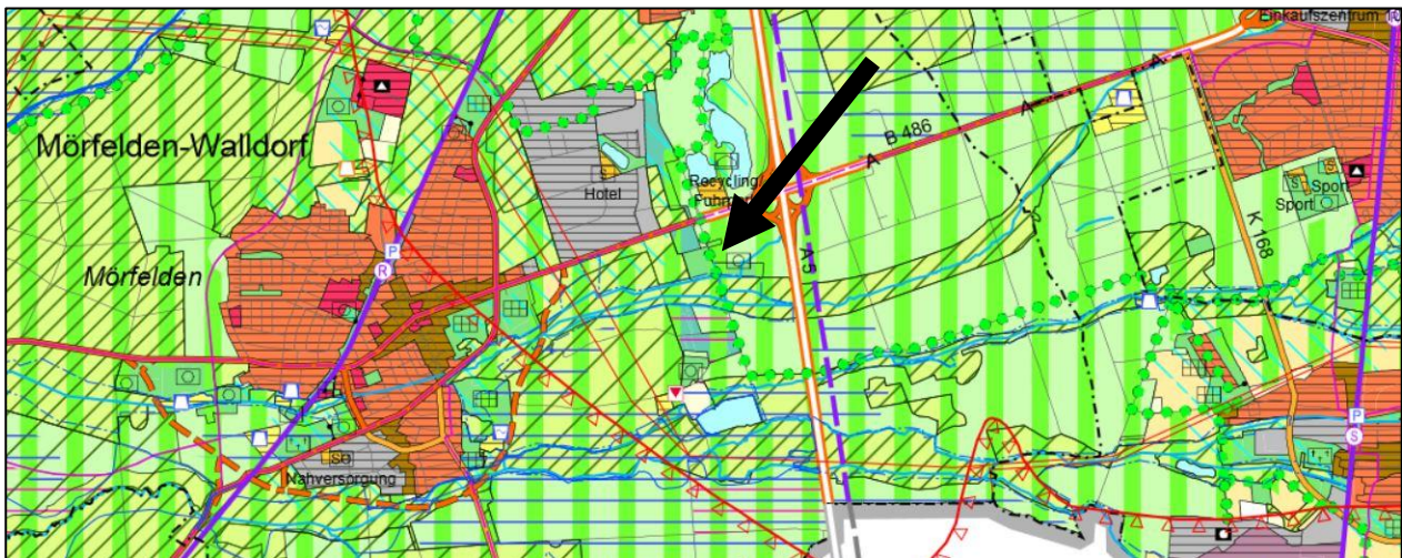
Abbildung 2: Regionaler Flächennutzungsplan 2010, Karte ist genordet, ohne Maßstab

Nachrichtliche Übernahme (gemäß § 9 Abs. 6 BauGB), Hinweise und Empfehlungen verschiedener Träger öffentlicher Belange, die bei nachfolgenden Planungen (Bauantrag, Bauausführung, Erschließungsplanung usw.) beachtet werden müssen.