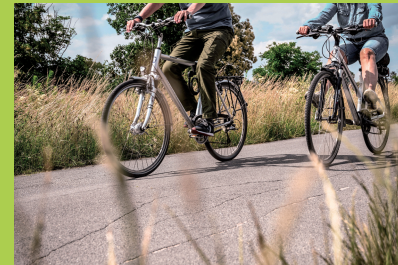
Foto-Aktion Stadtradeln 2023

Einsendeschluss für das Foto mit vollständigem Namen an stadtradeln@moerfelden-walldorf.de ist der 12. Juni. Die schönsten drei Bilder werden beim Abschlussfest mit einem Geschenkgutschein prämiert. Das Bild von Platz 1 erscheint nächstes Jahr im STADTRADELN-Flyer.