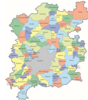
Die 80 Mitgliedskommunen des Regionalverbands

Hier auf unseren Seiten erfahren Sie mehr zu Thema Streuobst in der Region FrankfurtRheinMain und finden Aktivitäten sowie Ansprechpartner vor Ort.