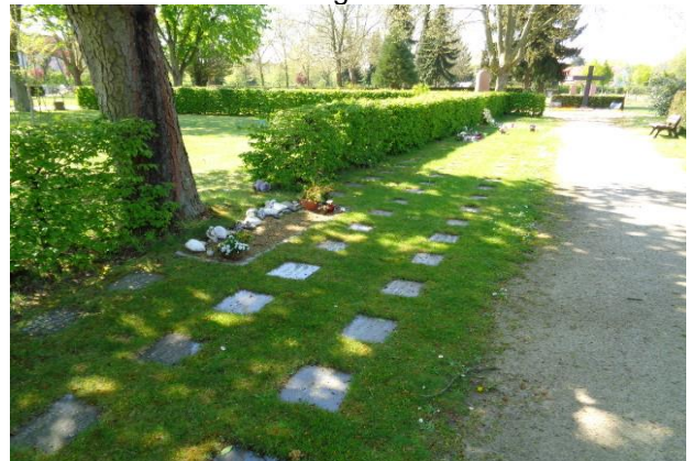
Stand: Januar 2017

Die Einebnung eines Urnenrasengrabes vor Ablauf der Ruhezeit ist nicht vorgesehen.