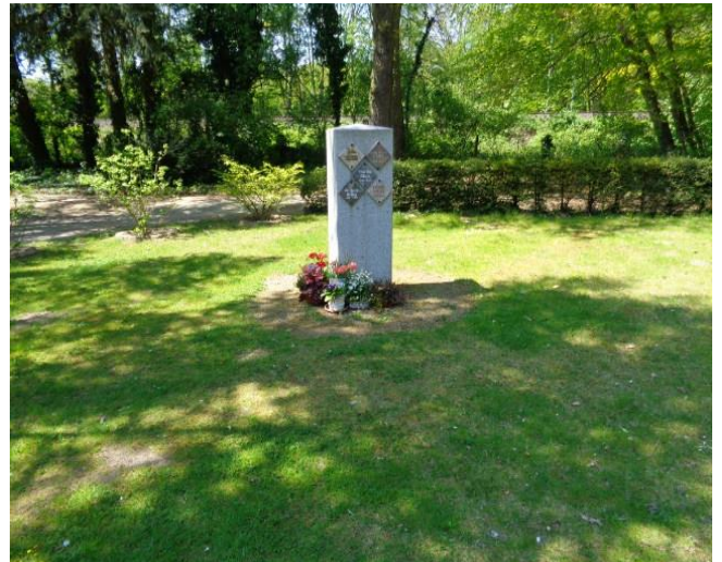
Stand: Januar 2017

Die Platten sind beim Erwerb der Grabstätte nicht enthalten.