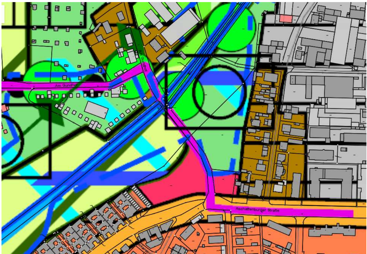
Auszug RegFNP 2010 im Katasterplan zum Gebiet (rote Kennzeichnung= Fläche für Gemeinbedarf)