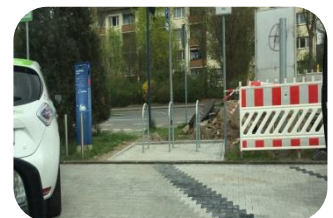
An den beiden E-Carsharing-Standorten Okrifteiler und Bürgermeister-Klingler-Straße wurden Abstellanlagen errichtet, damit man unkompliziert vom Rad auf das Carsharing-Auto umsteigen kann!