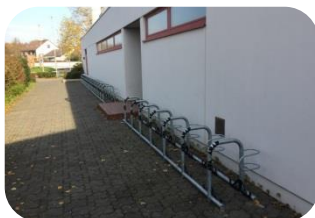
Im Stadtgebiet wurden 191 weitere Radabstellanlagen geschaffen. Hierzu zählen oben abgebildete Reihenanlagen und ...