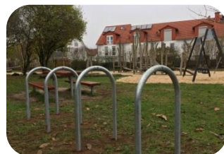
... Anlehnbügel im Außenbereich, an Spielplätzen aber auch im Straßenraum und auf Plätzen